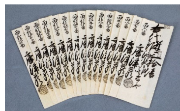
「米切手(唐津蔵)」 大同生命保険株式会社蔵 (大阪くらしの今昔館 企画展にて展示予定)

パネルの紹介 講演終了後、神戸大学附属中等教育学校の学生(高校1年生)の皆さんに、4階で開催中の関連パネル展についてご紹介いただきます。(15時30分~約30分間・3階ホール)