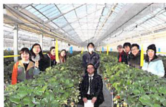
2018年 宮城県亶理町 Watari-cho, Miyagi Prefecture (2018)