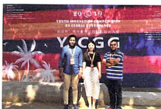
神戸大学の学生も2019YICGGに参加しました Kobe University students at the 2019 YICGG