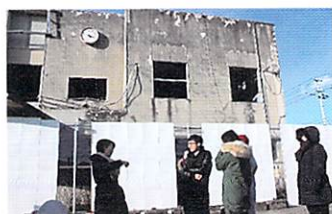
2017年 岩手県大槌町 Otsuchi-cho, Iwate Prefecture (2017)