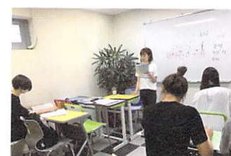
2019短期語学研修の様子 Language Fellowship in Summer 2019