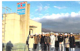
2020年 岩手県陸前高田市 Rikuzen Takata city, Iwate Prefecture (2020)