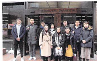
2019年 岩手県盛岡市 Morioka City, Iwate Prefecture (2019)