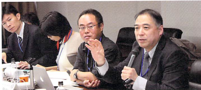
キャンパスアジアプログラムコンソーシアム大学の教員 (2019) CAMPUS Asia Consortium Universities' Professors

CAMPUS Asia Consortium held its annual symposium in a rotating basis (Kobe University – Fudan University – Korea University). In this occasion, faculty members have gathered to discuss their joint projects and students have had the opportunity to share and present their research works at the event. Each year more than 40 students and faculty members have joined the symposium and have had in-depth discussions on risk management issues.