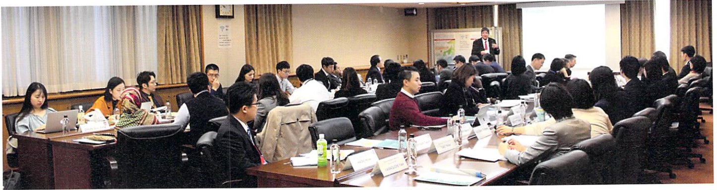
2019 キャンパスアジア・プログラム年次シンポジウムの様子 (神戸大学) 2019 Annual Symposium at Kobe University