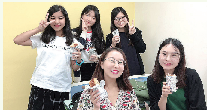
2018 短期語学研修の様子 Language Fellowship in summer 2018

Korea University offers Korean Language Fellowship and Research Fellowship twice a year to Kobe University's Masters and Doctoral students to promote the academic activities and Korean studies at their Institution. The University also provides financial support covering the travel expenses as well as a stipend for participants. The tuition for the language school will be also waived. Don't miss this precious opportunity and look out the application notice in June and November!