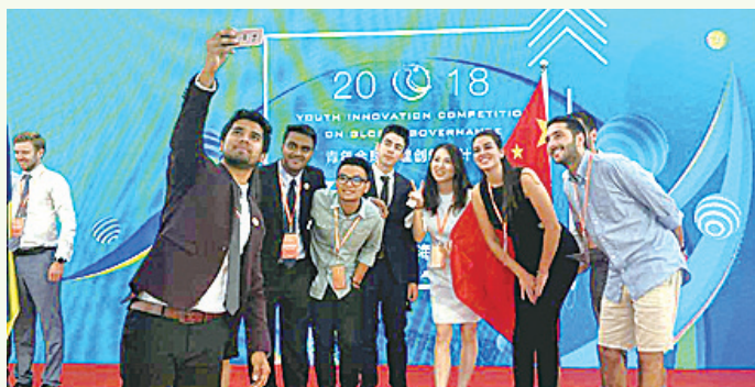
神戸大学の学生も2018YICGGに参加しました Kobe University students at the 2018 YICGG

Fudan University invites Kobe University students to their "Youth Innovation Competition on Global Governance (YICGG)," which is held on July, every year. This seven-day international competition gathers more than 100 students around the world to compete with their proposals and presentation skills. For those who are interested in a global career, you are invited to participate to the next YICGG, scheduled in Jakarta, Indonesia on July 2019!