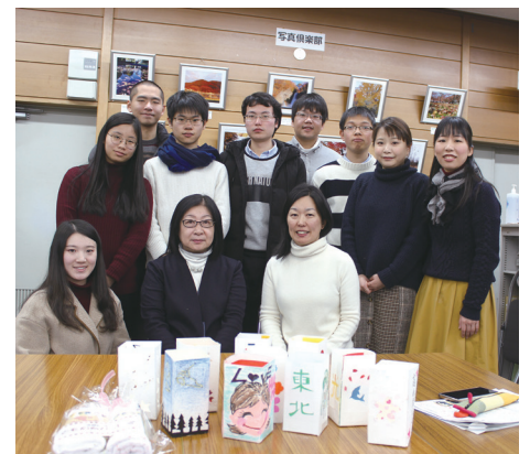
もりおか復興支援センターの活動を学んだ学生たち Participants have learned about the assistance activities of MSC