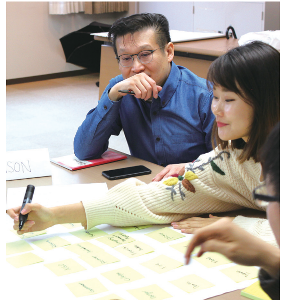
研修に参加する復旦大学と高麗大学の学生たち Participants from Fudan University and Korea University attending the short-term workshop

The participants had an inspiring study session by attending the "Risk Management" course at the GSICS and the field trips in Kobe City. The students stated that they will share the experiences with their friends back home. We look forward to welcoming new students to Kobe University's Campus Asia Program and expand the network of future experts on risk management.