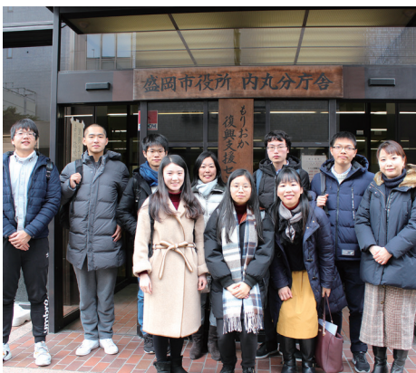
もりおか復興支援センター前で集合写真 At the entrance of Morioka Support Center for the Disaster-Affected People

Witnessing the real situation of the affected people and the reconstruction process, the students gained new insights on how to approach to risks from multiple perspectives.