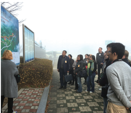
DMZの成り立ちについて説明を聞く参加者たち Explanation about the establishment of the DMZ

On November 10, 2018, the participants of the 2018 Annual Symposium had the opportunity to visit the Korean Demilitarized Zone (DMZ) in the Korean Peninsula.