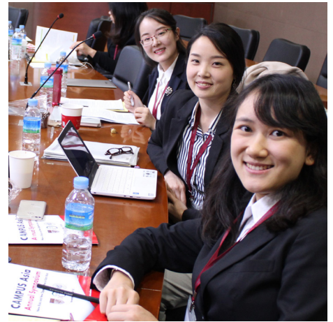
2018年シンポジウムの学生発表者の様子 Student presenters at the 2018 Annual Symposium