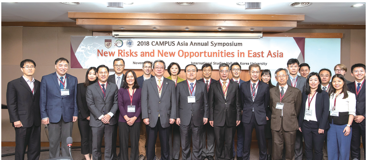
3大学の教職員が一堂に会しました Participants of the 2018 Annual Symposium at Korea University