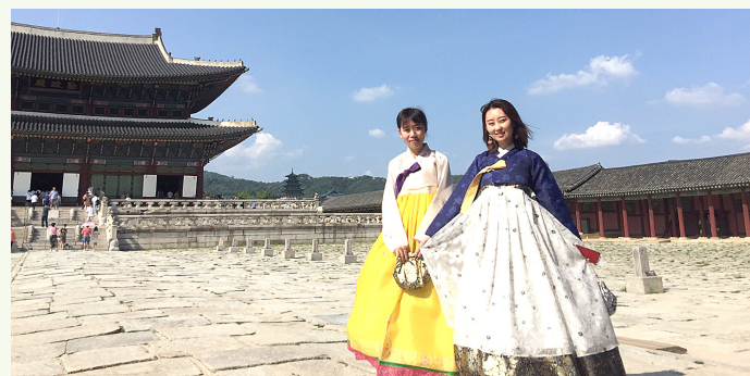
韓国文化体験 Cultural experiences in Korea