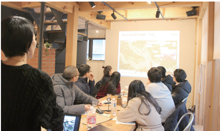
大槌町の復興過程に関する講義・ワークショップの様子 Lecture and workshop about reconstruction process of Otsuchi Town