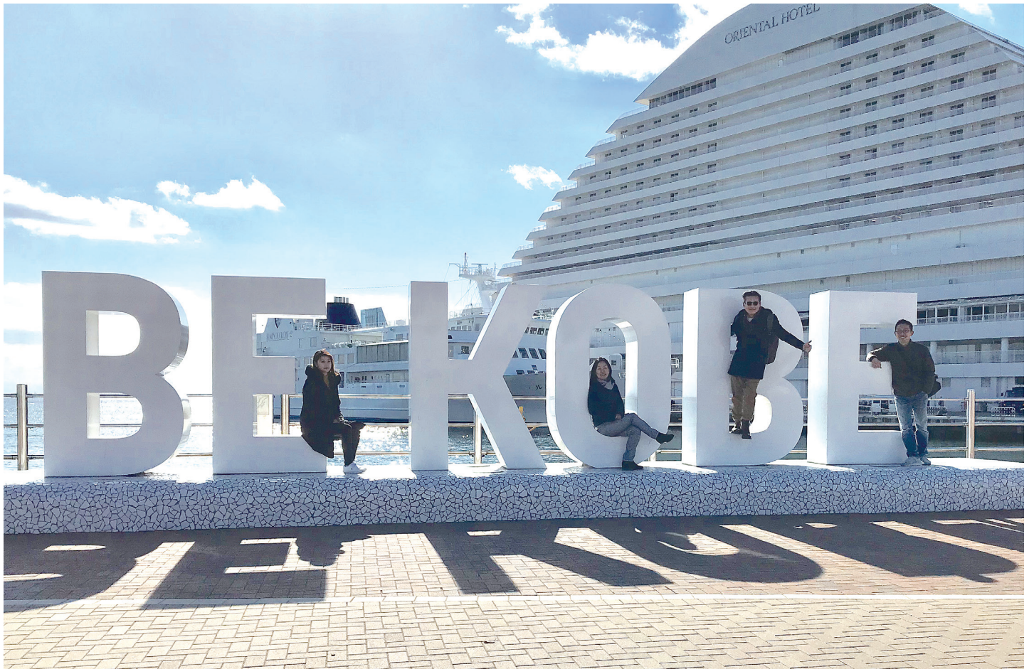
神戸港震災メモリアルパークを訪問しました Field trip to Port of Kobe Earthquake Memorial Park at the Meriken Park