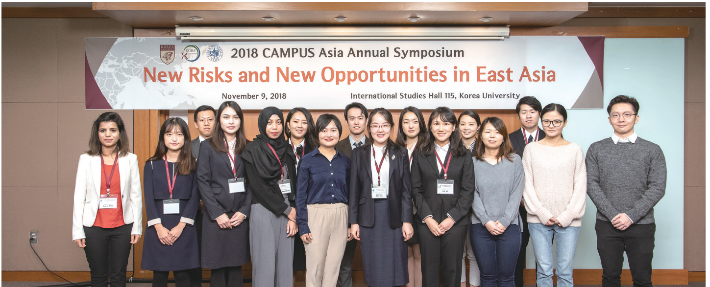
2018年シンポジウムに参加したプログラム学生たち Campus Asia Program students at the 2018 Annual Symposium, Korea University

2018年キャンパスアジア年次シンポジウムの翌日（11月10日）には、シンポジウム参加者を対象に、朝鮮半島の非武装地帯を訪問するスタディツアーが実施されました。