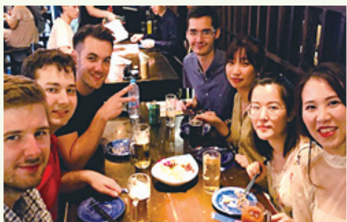
2018YICGG 参加学生同士の交流 Mingling with fellow participants at 2018 YICGG