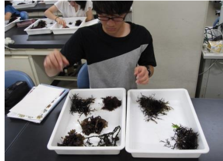
採集後の藻類を分類する様子