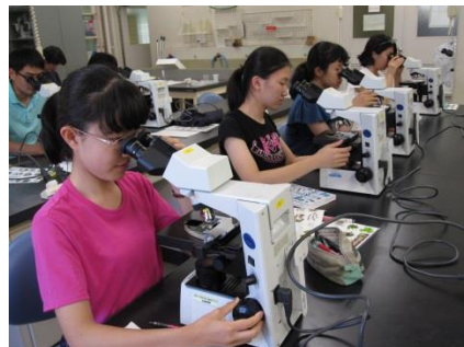
プランクトンの観察の様子