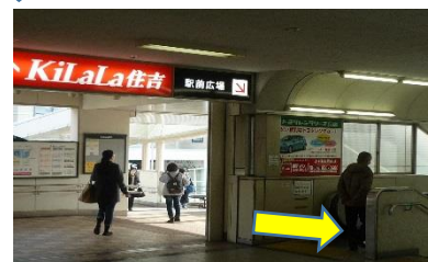
エスカレーターで駅前広場へ降りる