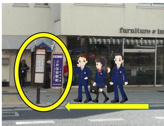
東を向いてバス停に並ぶ