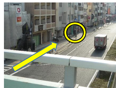
歩道橋を降りて西へ