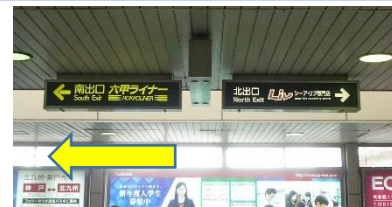
改札を出て南出口方面へ