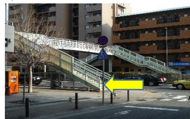
歩道橋で2号線を渡る