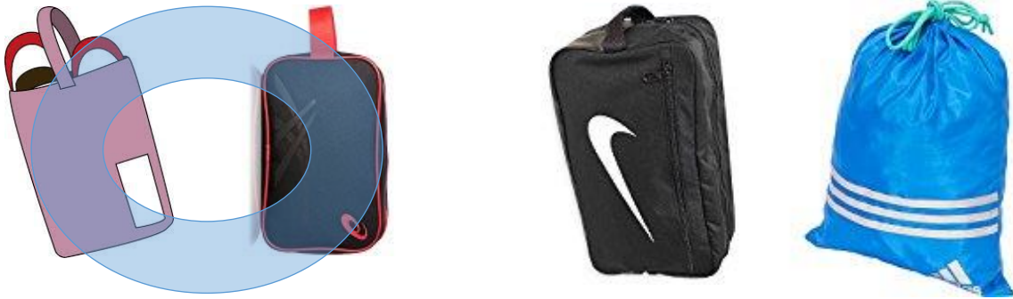
大型ケースや大きな袋はNG