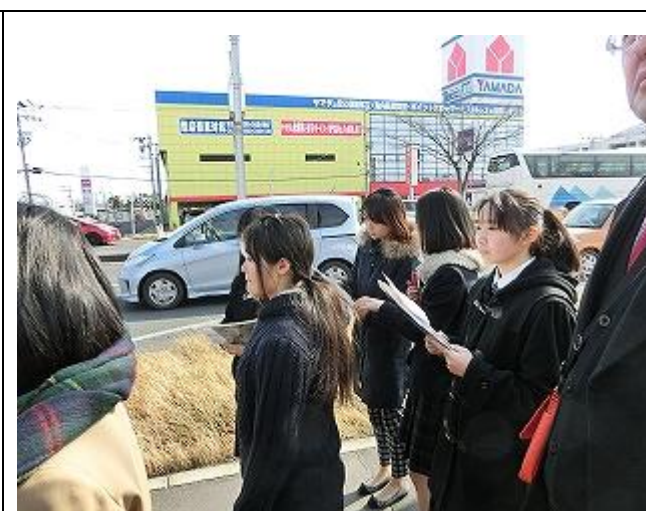
多賀城高等学校生徒会生徒による街歩き