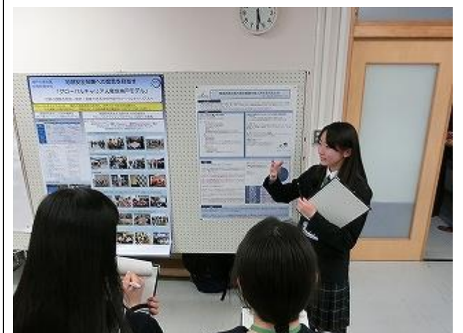
課題研究のポスター発表