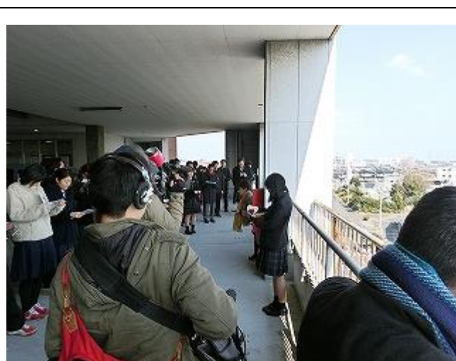
多賀城高等学校生徒会生徒による街歩き