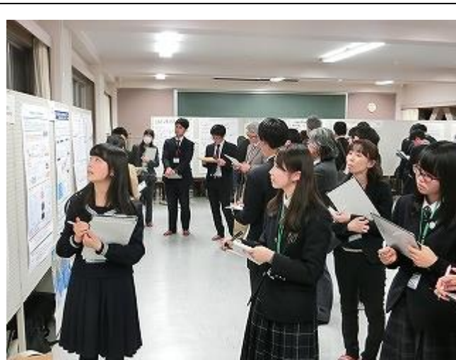
他校の発表を聞いています