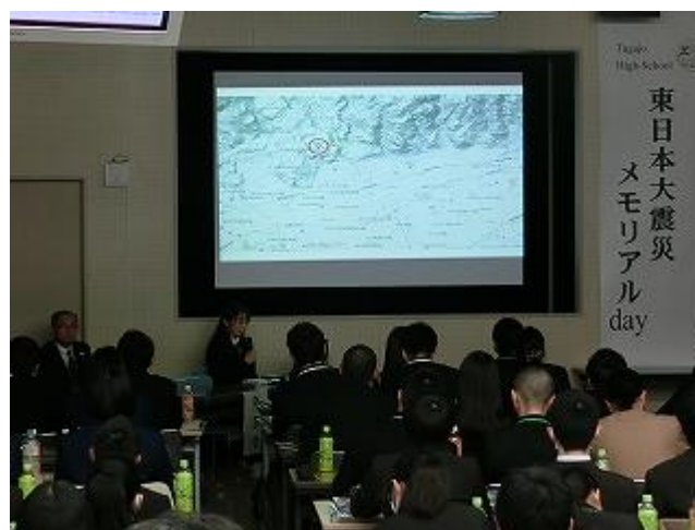
本校の地理的特性を交えながら紹介しました