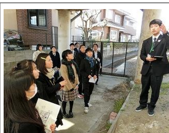
多賀城高等学校生徒会生徒による街歩き