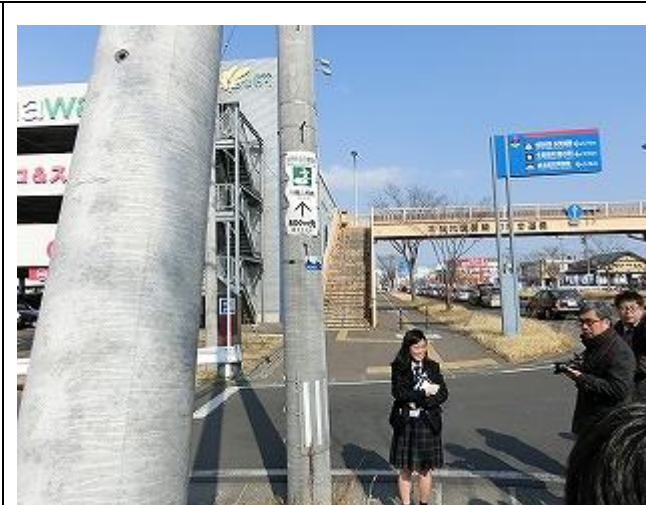
多賀城高等学校生徒会生徒による街歩き