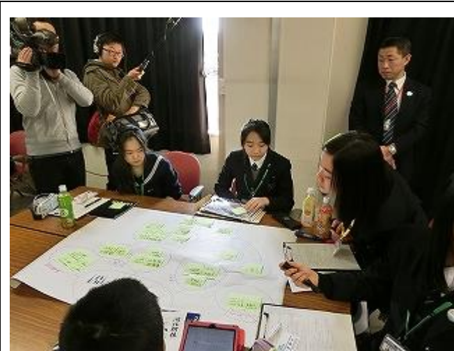
ワークショップ「24 時間前に戻れたら」