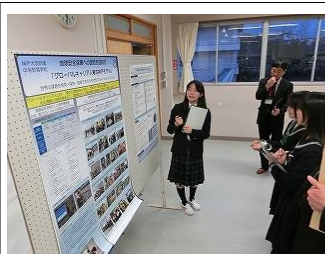
課題研究のポスター発表