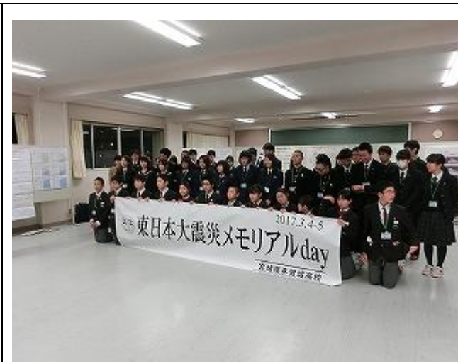
全国 12 校から 60 人の生徒が集まりました