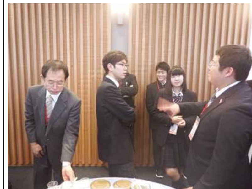
一般公開されたプレゼンテーションの様子です。