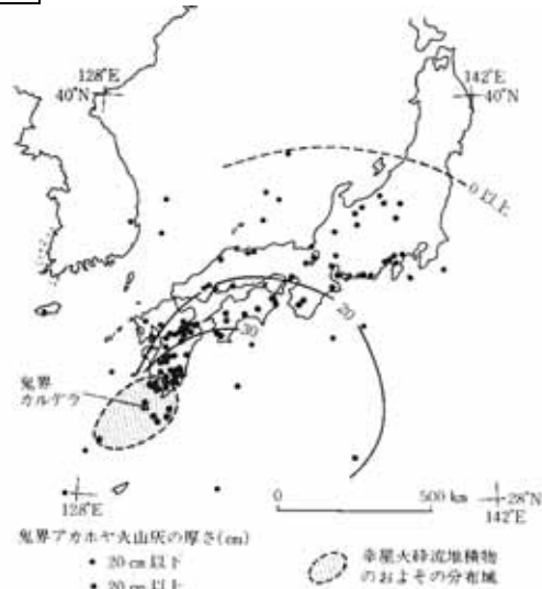
図2.6 現在までに知られている鬼界アカホヤ火山灰の分布地点と厚さ。(町田・新井両氏, 1983)

日本列島では1万年に1回程度の頻度で VEI = 7クラスの巨大噴火が生じる。このような噴火の兆しがあった場合どのように対処するべきか？ 実際に起こったらどのような災害が予想されるか？