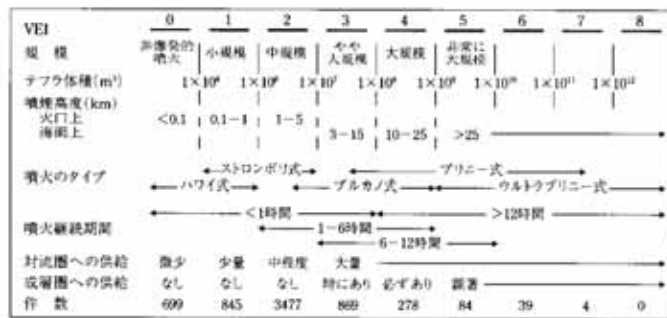
図 1.10 火山爆発指数 (VEI) の定義 [Simkin and Siebert, 1994 を一部改変]