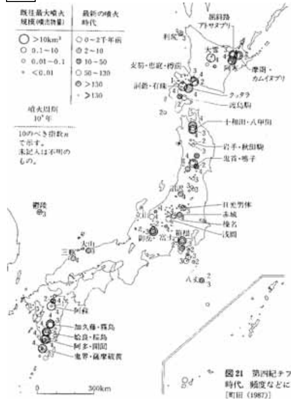
図 21 第四紀テファ: 時代、頻度などによる (町田 (1987))